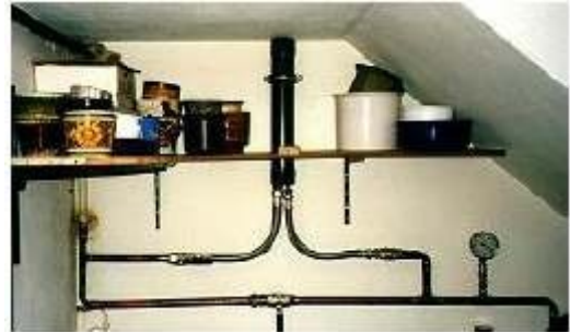
Montage nach der Wasseruhr

Der Aqua-Lyros® -Wasser-Aktivator (Modell « Herakles ») installiert in 6-Familienhaus mit Bypass & Anschlüssen nach unten