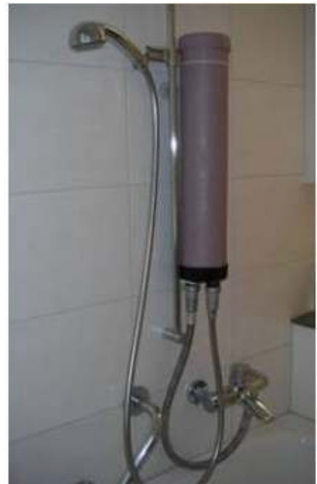
Sehr einfache Montage in Dusche und Bad

Ein- und Ausgang des Aqua-Lyros ® - Wasser-Aktivators sind deutlich markiert und müssen beachtet werden, da die Funktion des Geräts entscheidend vom richtigen Anschließen des Zu- und Abflusses abhängt. Die Anschlüsse haben 1 Zoll Durchmesser. Die im Lieferumfang inbegriffenen Reduktionsstücke erlauben ebenfalls den Anschluss der handelsüblichen Duschschräume. Der Aktivator kann sowohl bei kaltem wie auch bei warmem/ heißem Wasser angewandt werden.